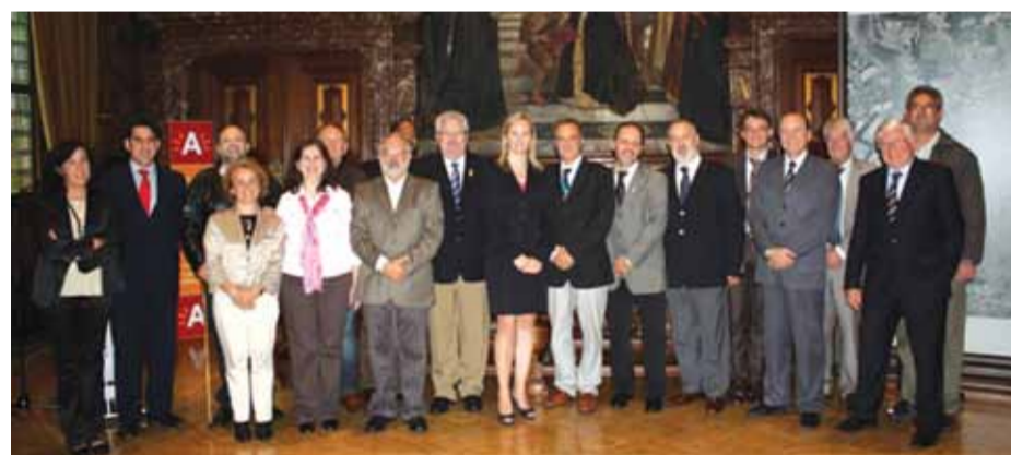
Membros do CDES e do CESE cobram mais participação para integração social entre nações

O intercâmbio de ideias e propostas entre o Brasil, pelo CDES, e da União Europeia, por meio do CESE, acontece desde 2003, quando se estabeleceu oficialmente o diálogo entre os conselhos. O debate pretende ser um canal permanente de interlocução entre sociedade e governantes. Os fóruns