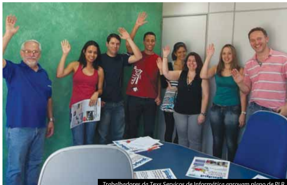
Trabalhadores da Teks Serviços de Informática aprovam plano de PLR

A categoria de TI vive um momento aquecido em relação a acordos de Participação nos Lucros e Resultados (PLR). Muitas empresas começam a entender que o benefício aumenta a produtividade e motiva a categoria. Vale lembrar que muitas companhias ainda estão em processo de negociação e este percentual vai aumentar.