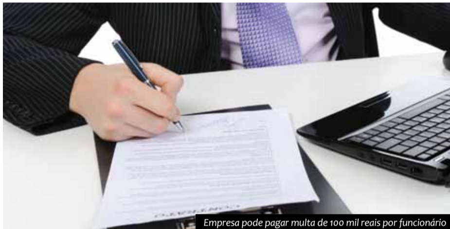
Empresa pode pagar multa de 100 mil reais por funcionário

cisórias. O Sindpd e o MPT constataram o procedimento irregular e agiram firmemente para que a companhia transformasse os pedidos de demissão em dispensa sem justa causa, evitando, assim, que os trabalhadores fossem prejudicados. ■