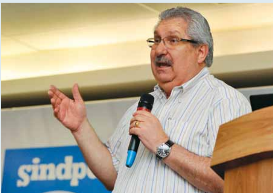
Presidente do Sindpd