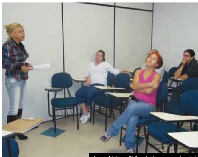
Assembleia de PLR na Unisoma, em Jundiaí