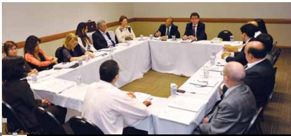
Advogados da capital paulista e interior do estado em reunião no Hotel Holiday Inn em São Paulo