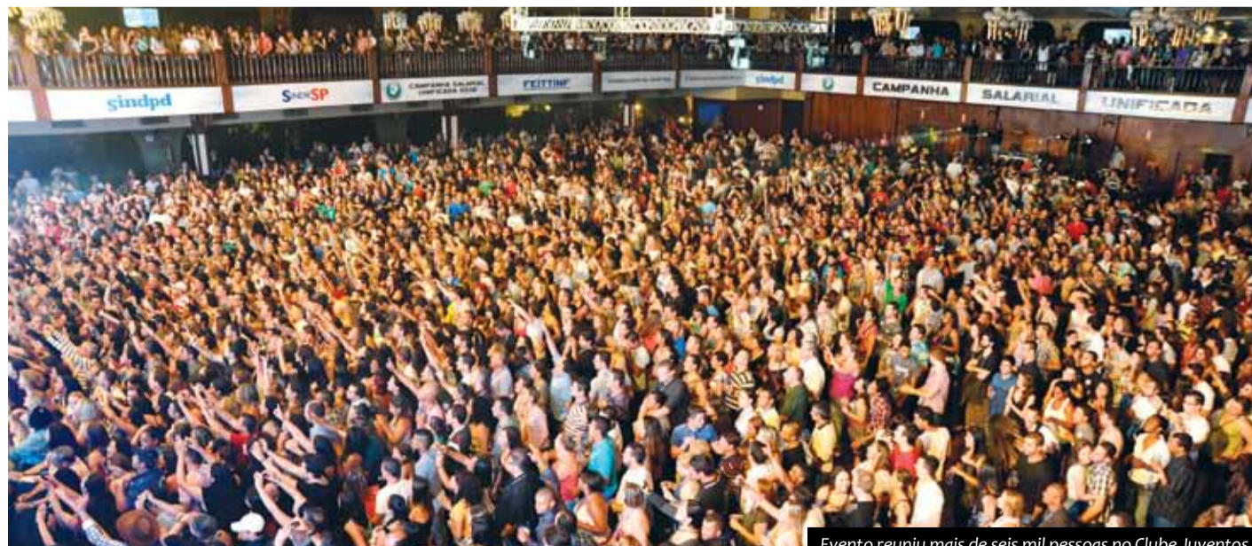
Evento reuniu mais de seis mil pessoas no Clube Juventus