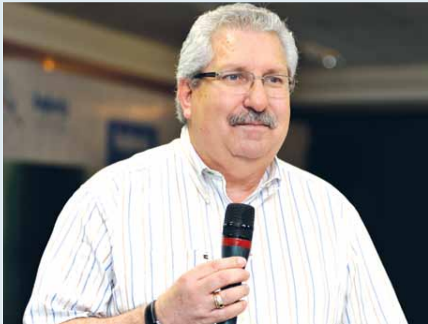
Presidente do Sindpd