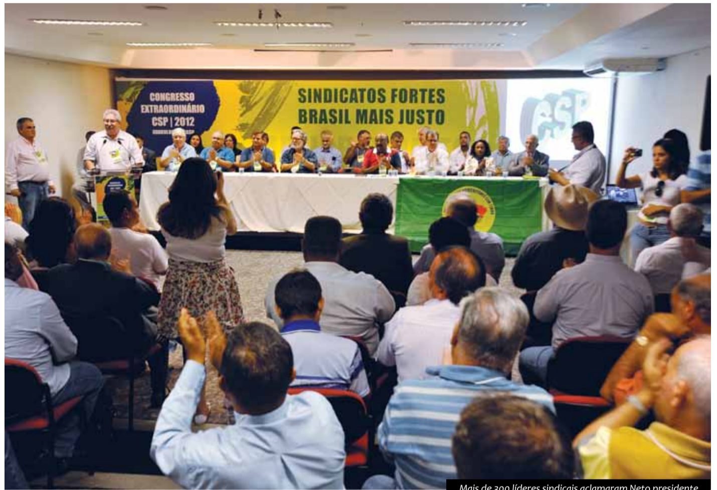
Mais de 300 líderes sindicais aclamaram Neto presidente

A reestruturação da CSP e a seriedade dos dirigentes que constroem uma alter-