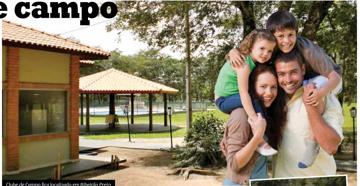
Clube de Campo fica localizado em Ribeirão Preto