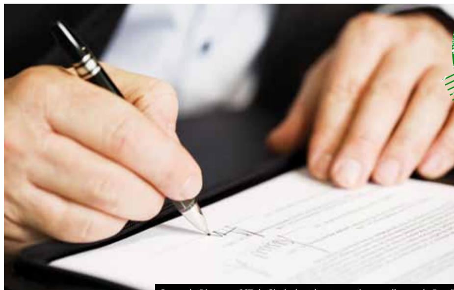
Segundo Dieese, a CCT do Sindpd está entre as cinco melhores do Brasil

A Convenção Coletiva de Trabalho (CCT) desse ano foi registrada no Ministério do Trabalho e já está disponível no site do Sindpd. O processo de registro SP 001523/2012, oficializa as vitórias da Campanha Salarial de 2012 para a categoria de TI. O Sindpd e o sindicato patronal (Seprosp) fecharam acordo na quarta rodada de negociação, realizada no dia 24 de janeiro. O destaque da CCT deste ano é a implantação do plano de Participação nos Lucros e Resultados (PLR) nas empresas com mais de 50 funcionários e a inclusão do Vale Refeição no va-