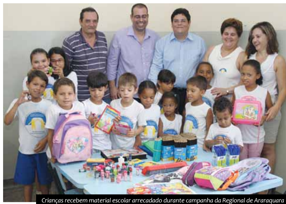
Crianças recebem material escolar arrecadado durante campanha da Regional de Araraquara

A “Campanha Volta às Aulas Solidária” realizada pela regional do Sindpd de Araraquara foi um sucesso. Ao todo foram arrecadados 1.298 itens entre lápis, apontadores, giz de cera, papel sulfite, livros, borrachas, pastas, canetas, régua, cadernos, tintas guache, massa de modelar, colas e mochilas. O material escolar foi doado