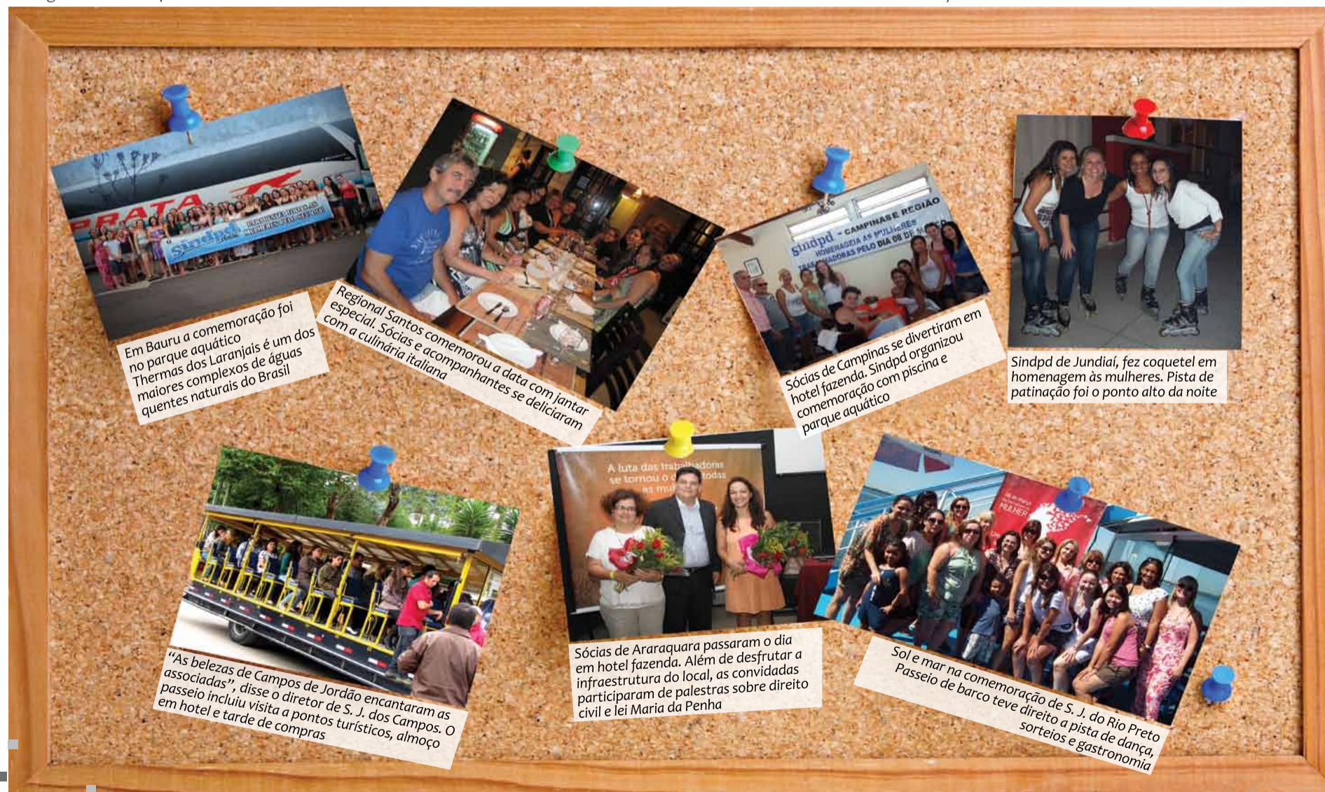
Em Bauri a comemoração foi no parque aquático Thermas dos Laranjais é um dos maiores complexos de águas quentes naturais do Brasil

As regionais do Sindpd também celebraram o Dia Internacional da Mulher. Confira as fotos e mais detalhes dessas comemorações.