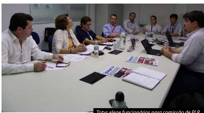
Totvs elege funcionários para comissão de PLR