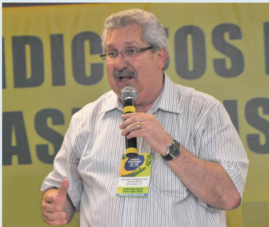
Presidente do Sindpd