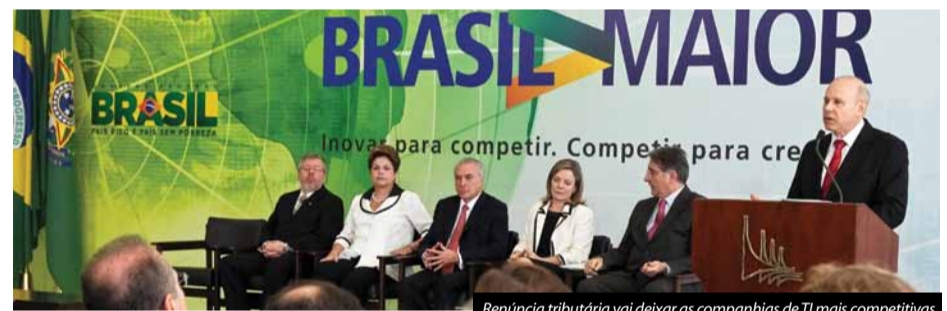
Renúncia tributária vai deixar as companhias de TI mais competitivas