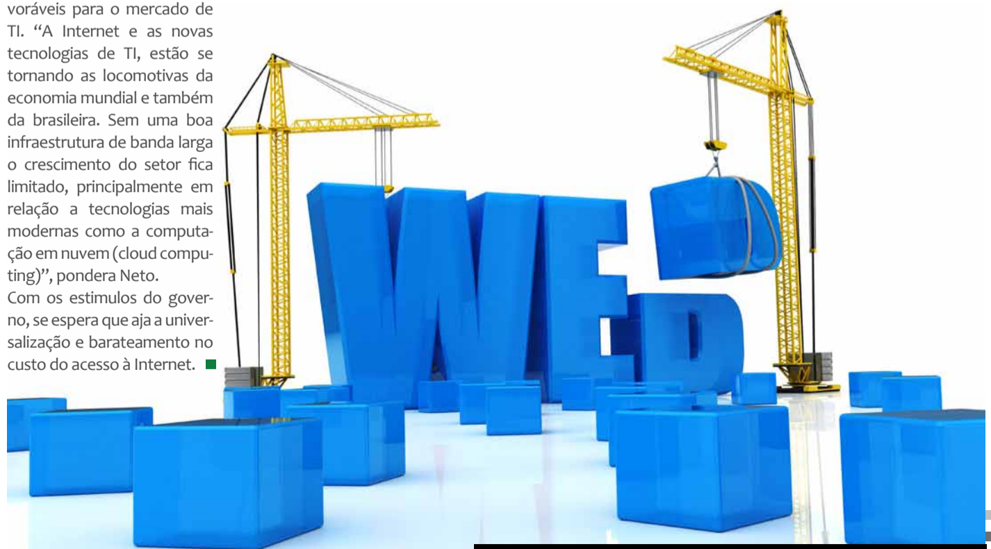
O Brasil é a sétima potência mundial da internet, mercado responsável por 2,2% do PIB nacional

considera os incentivos favoráveis para o mercado de TI. “A Internet e as novas tecnologias de TI, estão se tomando as locomotivas da economia mundial e também da brasileira. Sem uma boa infraestrutura de banda larga o crescimento do setor fica limitado, principalmente em relação a tecnologias mais modernas como a computação em nuvem (cloud computing)”, pondera Neto. Com os estímulos do governo, se espera que aja a universalização e barateamento no custo do acesso à Internet. ■