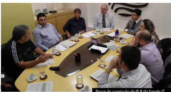
Posse da comissão de PLR da Sonda IT