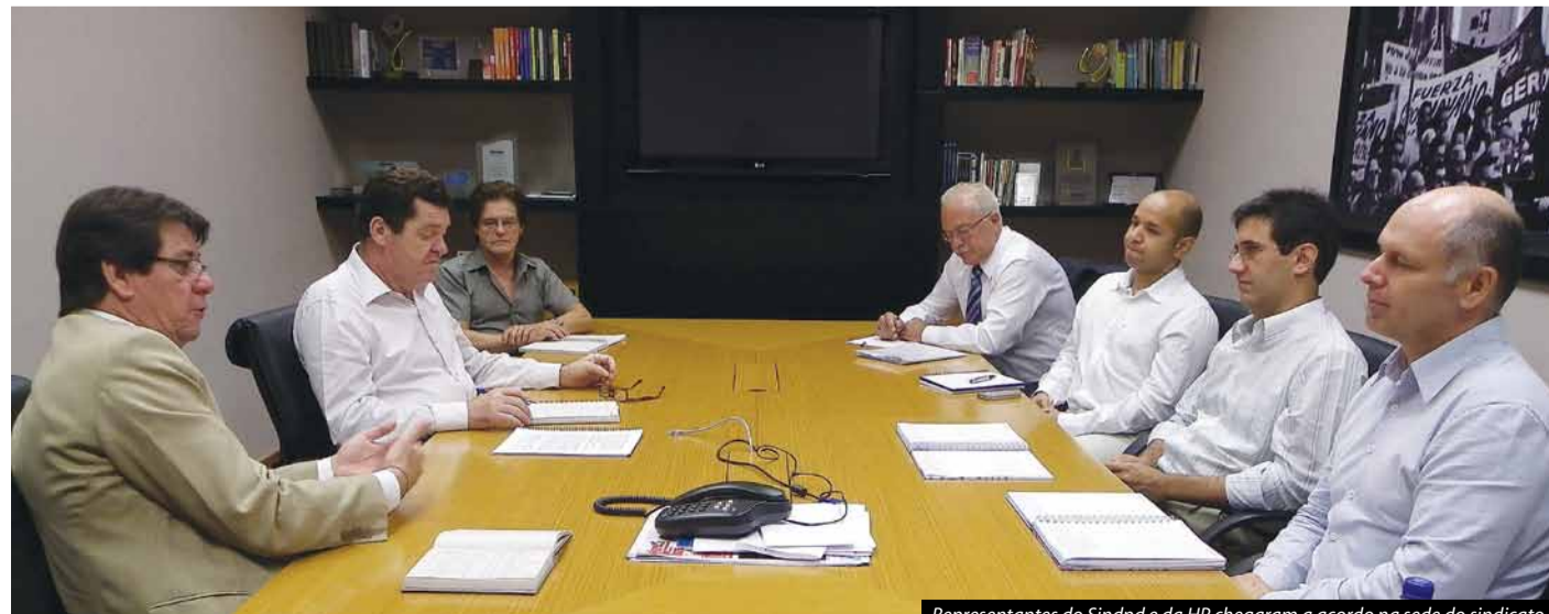
Representantes do Sindpd e da HP chegaram a acordo na sede do sindicato

O Sindpd moveu ação semelhante contra a CPM Braxis. Uma audiência está marcada para o dia 2 de maio. ■