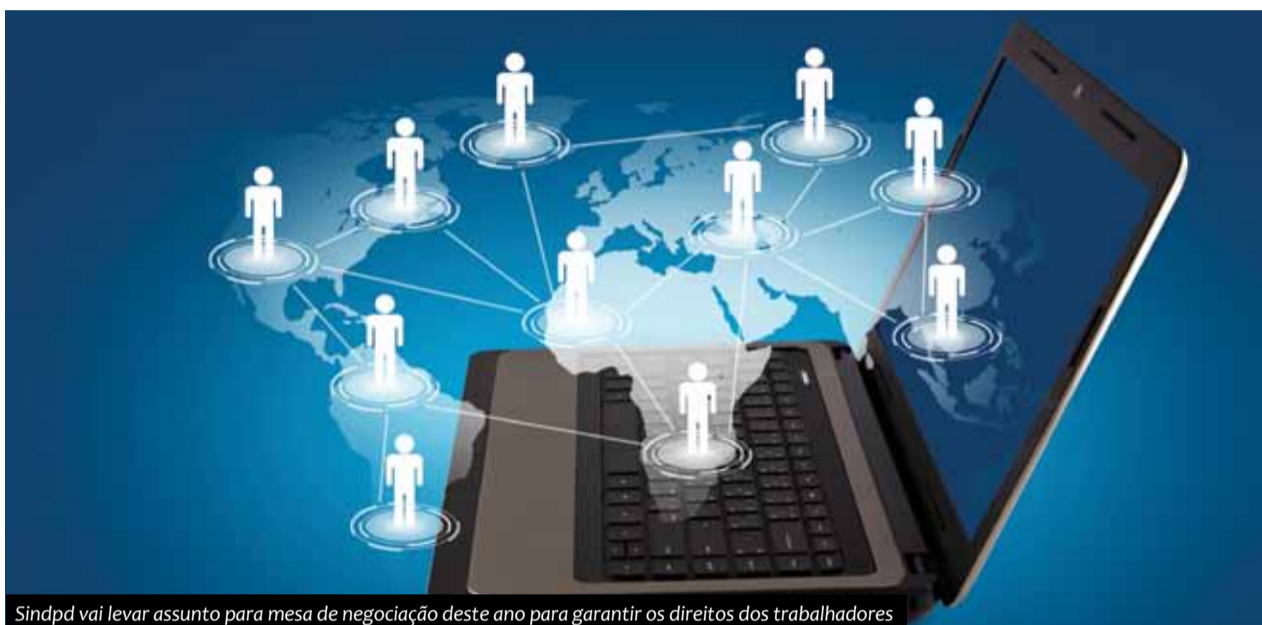
Sindpd vai levar assunto para mesa de negociação deste ano para garantir os direitos dos trabalhadores

Essa alteração é uma tentativa de acompanhar o avanço da tecnologia e o aumento da preocupação com qualidade de vida. Mesmo sendo teletrabalho ou trabalho remoto, o trabalhador tem assegurado os direitos do registro em carteira e não pode mais ser tratado como autônomo. ■