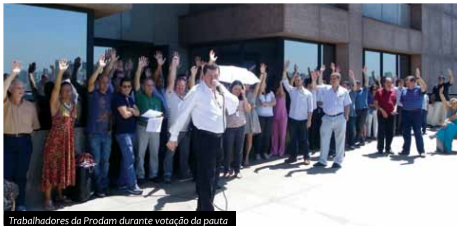
Trabalhadores da Prodam durante votação da pauta

2011 caminhe de forma célere. Estamos fazendo uma pauta para a Prodam que basicamente repete a do ano passado. Isso nos leva a crer que teremos uma ótima negociação, trazendo segurança aos trabalhadores” frisa. ■