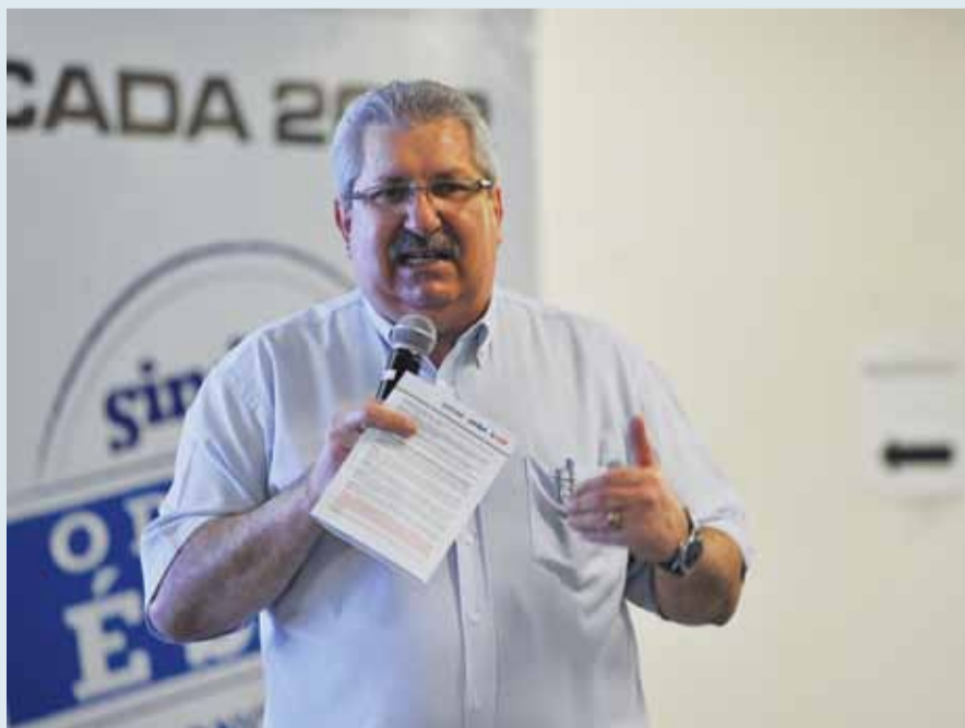
Presidente do Sindpd