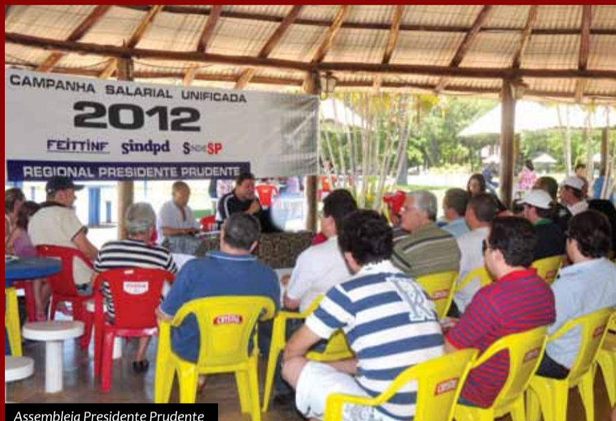
Assembleia Presidente Prudente