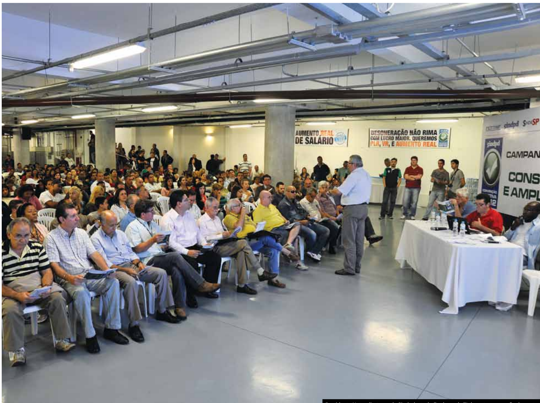
Presidente Neto, diretores do Sindpd e trabalhadores de TI durante aprovação da pauta

Trabalhadores definem em assembleia as metas da campanha salarial. Além de lutar por novos reajustes, o Sindpd busca consolidar os direitos que foram adquiridos no Tribunal Regional do Trabalho