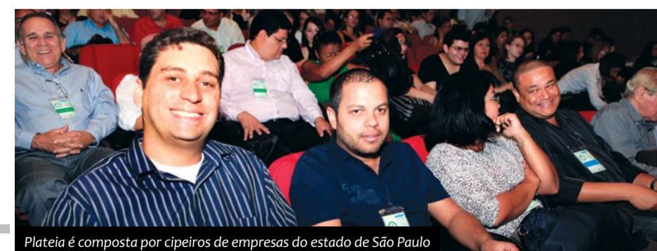
Plateia é composta por cipeiros de empresas do estado de São Paulo