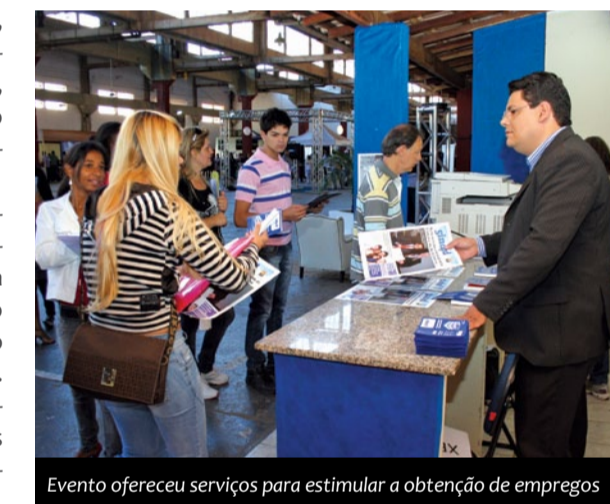
Evento ofereceu serviços para estimular a obtenção de empregos