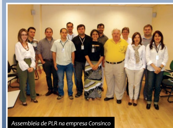
Assembleia de PLR na empresa Consinco

As empresas Agrometrika, GRV e Biffi & Fava selaram acordos de PLR. O destaque destas negociações é que todas as empresas não possuem a quantidade mínima de 50 empregados, que a CCT estipula como obrigatória para formulação do plano. A data para a disponibilização do benefício das empresas Agrometrika e GRV será no dia 15 de dezembro deste ano. Já a Biffi & Fava fará o pagamento no dia 15 de fevereiro de 2013. Também pela primeira vez, a empresa Consinco fechou acordo de PLR. Os estudos do plano foram elaborados por uma empresa de consultoria com a participação dos diretores da empresa e a comissão de negociação, composta por gestores de diversos departamentos. O plano foi aprovado pelos trabalhadores e o pagamento será feito no dia 15 de outubro de 2013.