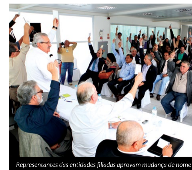
Representantes das entidades filiadas aprovam mudança de nome

A CSB tem registrado até o momento 313 entidades sindicais filiadas e outras 34 em processo de validação. Ao todo, estão cadastradas 20 federações. ■