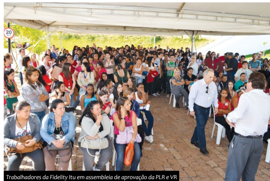
Trabalhadores da Fidelity Itu em assembleia de aprovação da PLR e VR

Sindpd organizou uma verdadeira força-tarefa para ouvir todos os trabalhadores