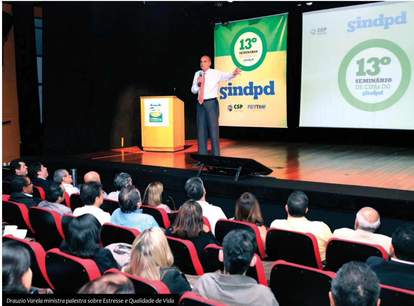
Drauzio Varella ministra palestra sobre Estresse e Qualidade de Vida

dos novos desafios da vida contemporânea. As companhias vivem em um ambiente competitivo e, cada vez mais, é exigida dos trabalhadores a capacidade de suportar cobranças e viver constantemente sob pressão. “O seminário tem