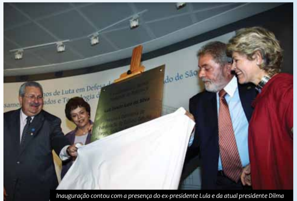
Inauguração contou com a presença do ex-presidente Lula e da atual presidente Dilma