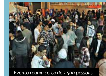
Evento reuniu cerca de 2.500 pessoas