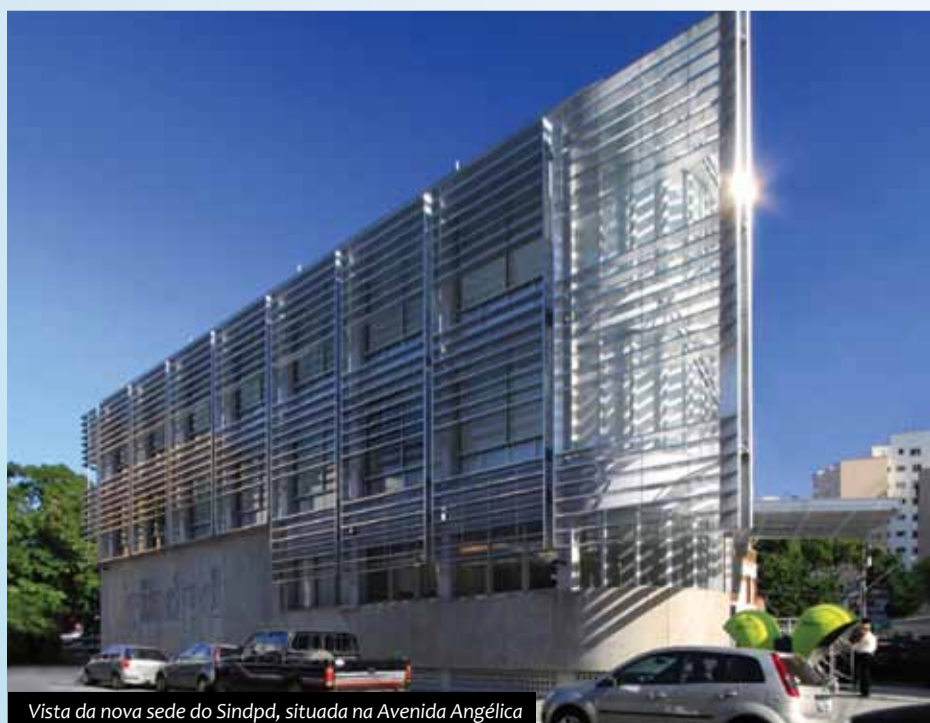
Vista da nova sede do Sindpd, situada na Avenida Angélica