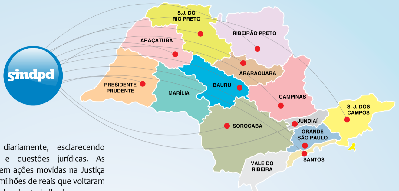
Sindpd possui 11 regionais pelo interior do estado

A inauguração da sede, em 22 de janeiro de 2010, contou com a presença do ex-presidente da República, Luiz Inácio Lula da Silva, e da atual presidente, Dilma Rousseff, que ressaltaram a importância do Sindpd para os trabalhadores de TI e para o Brasil. Além da sede própria, o Sindpd conta com mais 11 regionais distribuídas estrategicamente pelo interior do estado. Prestes a completar 28 anos - no dia 14 de agosto - o sindicato construiu um sólido compromisso com a categoria, ratificado pelo grande número de associados, que chega a 47 mil. O Sindpd é o maior representante sindical brasileiro dos profissionais de TI. Quase metade dos trabalhadores do setor - cerca de 100 mil pessoas - se beneficia com as conquistas desta gestão. ■