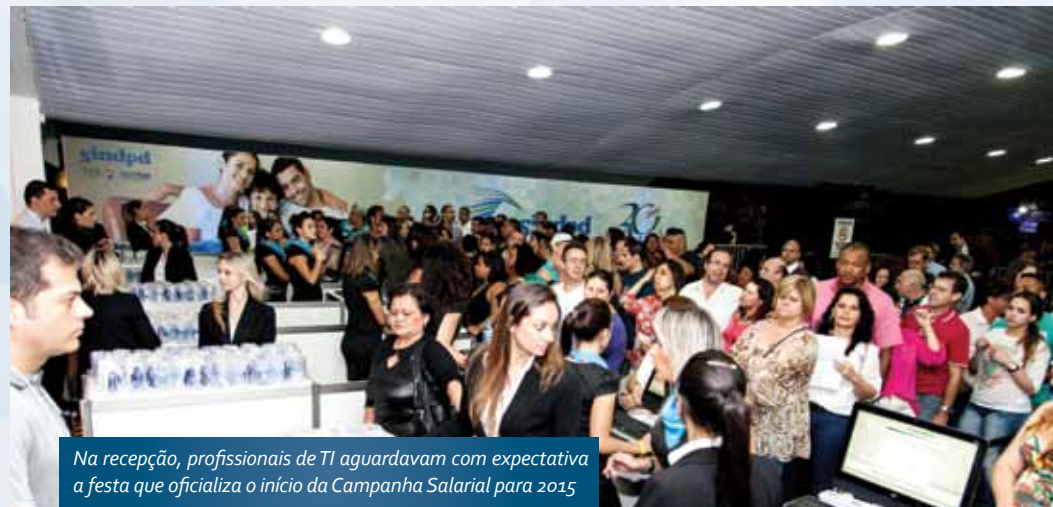
Na recepção, profissionais de TI aguardavam com expectativa a festa que oficializa o início da Campanha Salarial para 2015

“Venho no SindpdFest há quatro anos e curto muito a festa, reencontro amigos que estão trabalhando em outras empresas. Vim ver o Jota Quest. Os prêmios estão muito bons; se eu não ganhar o carro, pelo menos o Xbox eu queria.”