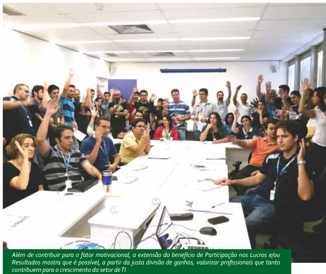
Além de contribuir para o fator motivacional, a extensão do benefício de Participação nos Lucros e/ou Resultados mostra que é possível, a partir da justa divisão de ganhos, valorizar profissionais que tanto contribuem para o crescimento do setor de TI.

O objetivo do Sindpd é continuar o trabalho de valorização e reconhecimento da categoria na Campanha Salarial de 2015, para consolidar o pagamento da PLR, além do vale-refeição e aumento real de salário, pontos essenciais para o desenvolvimento dos empregados e do setor.