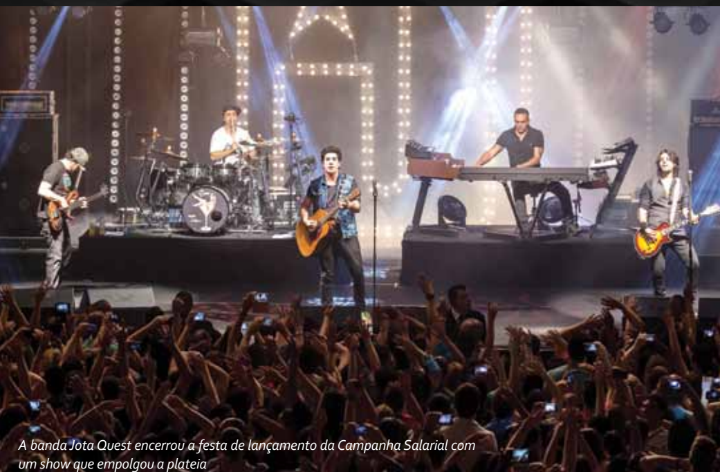
A banda Jota Quest encerrou a festa de lançamento da Campanha Salarial com um show que empolgou a plateia