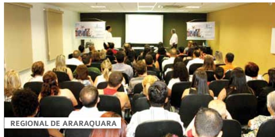
REGIONAL DE ARARAQUARA