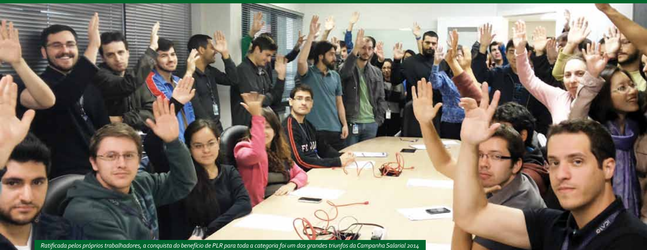
Ratificada pelos próprios trabalhadores, a conquista do benefício de PLR para toda a categoria foi um dos grandes triunfos da Campanha Salarial 2014.