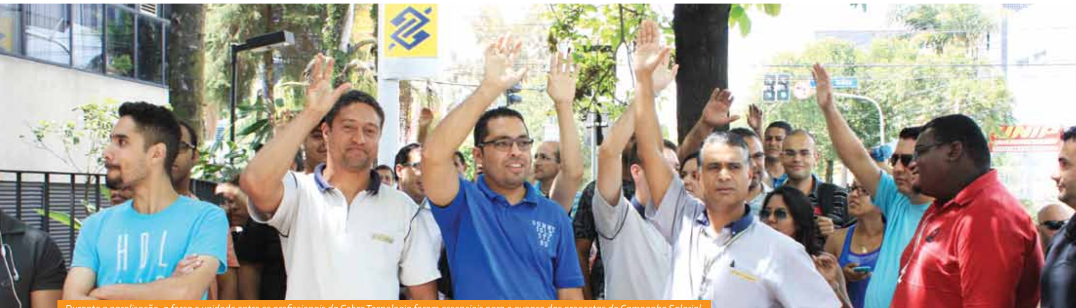
Durante a paralisação, a força e unidade entre os profissionais da Cobra Tecnologia foram essenciais para o avanço das propostas da Campanha Salarial

Proposta foi aprovada sem unanimidade, e funcionários de São Paulo voltaram ao trabalho