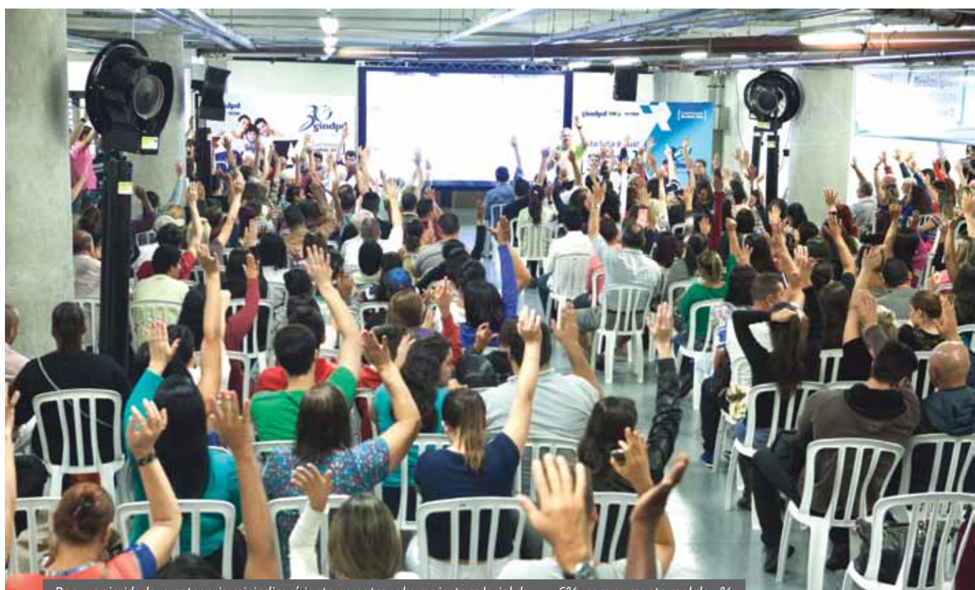
Por unanimidade, a categoria reivindicará junto ao patronal o reajuste salarial de 10,06%, com aumento real de 4%