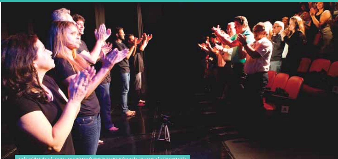
Aplaudidos de pé, os novos artistas foram reconhecidos pela impecável apresentação

Amigos, familiares e convidados prestigiaram exibição de peça dos colegas que estão iniciando na dramaturgia