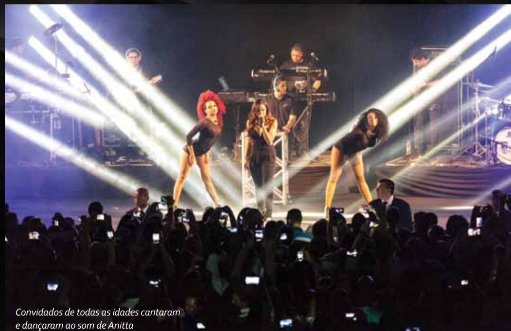
Convidados de todas as idades cantaram e dançaram ao som de Anitta