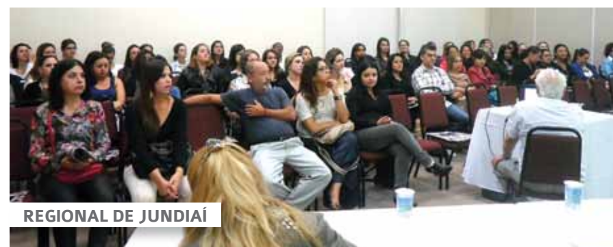
REGIONAL DE JUNDIAÍ