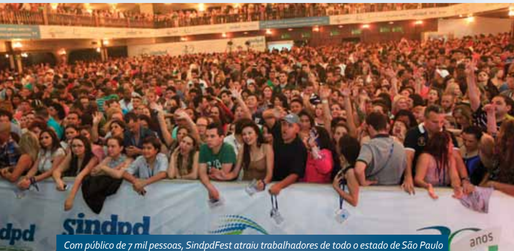
Com público de 7 mil pessoas, SindpdFest atraiu trabalhadores de todo o estado de São Paulo

Os prêmios desta edição do SindpdFest foram ainda mais especiais. Dois carros Volkswagen Up! 0 km, além de duas TVs, um Xbox One e um smartphone foram os presentes da noite para os associados.