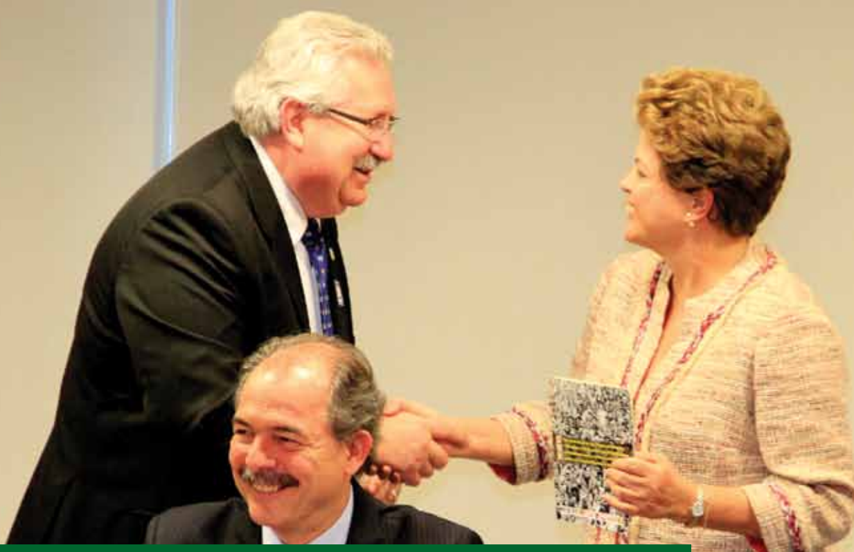
Na ocasião, Antonio Neto entregou à presidenta cartilha de recomendações do Grupo dos Trabalhadores da Comissão Nacional da Verdade

Presidenta se comprometeu a rever medida que foi contrabandeada no Congresso